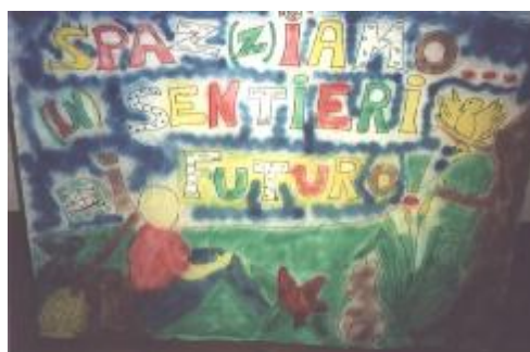
LO STRISCIONE di “SPAZ(Z)IAMO